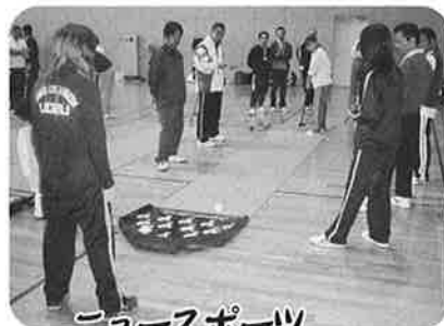
ニュースポーツ 講師派遣事業