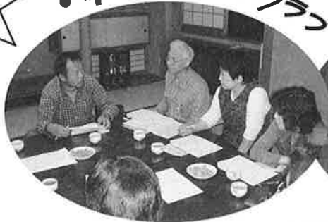
設立に向けての話し合い

財団法人 日本体育協会が文部科学省から委託されている、平成18年度総合型地域スポーツクラブ育成推進事業として認められた育成指定クラブの一つになりました。