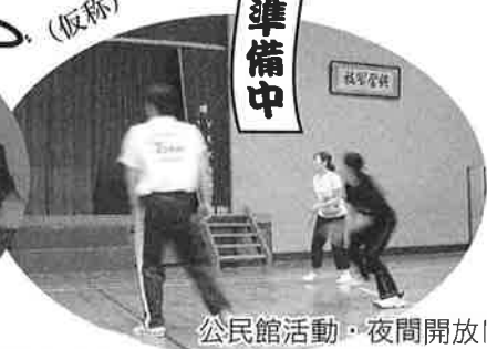
公民館活動・夜間開放によるスポーツ活動